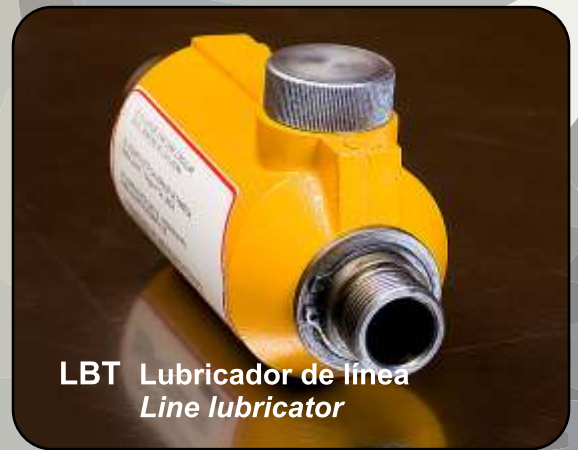
LBT Lubricador de línea Line lubricator

With twist grip throttle and pressure control, longer hose sets can be supplied by special order.